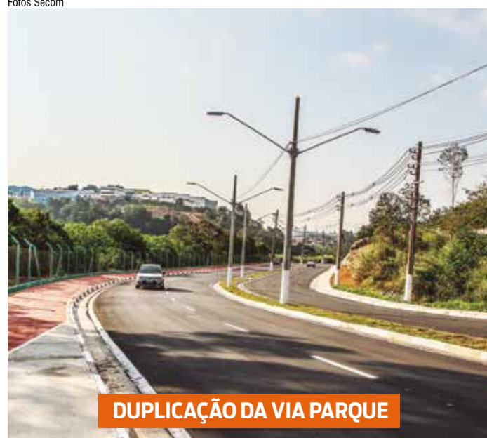
DUPLICAÇÃO DA VIA PARQUE