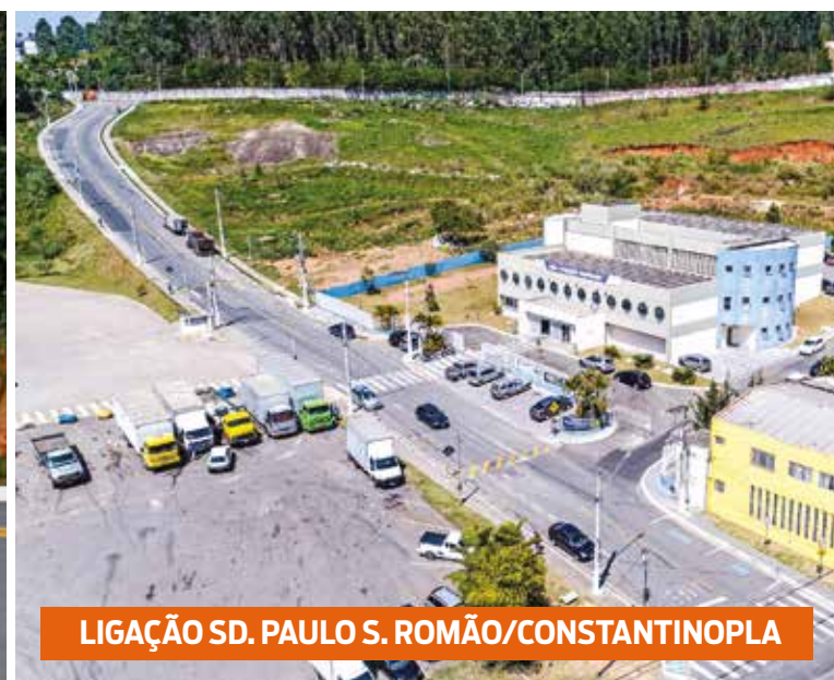
LIGAÇÃO SD. PAULO S. ROMÃO/CONSTANTINOPLA