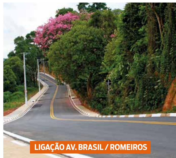
LIGAÇÃO AV. BRASIL / ROMEIROS