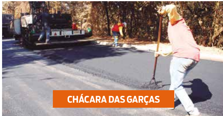
CHÁCARA DAS GARÇAS