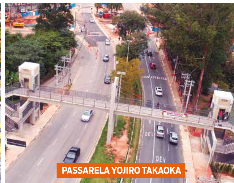
PASSARELA YOJIRO TAKAOKA

As duplicações da Via Parque e Paiol Velho, além da Ligação da Av. Brasil com a Estrada dos Romeiros e a Passarela na Av. Yojiro Takaoka são algumas das obras que contribuíram para fluidez do trânsito, melhorando a economia, gerando empregos e mobilidade para motoristas, trabalhadores e estudantes do município.