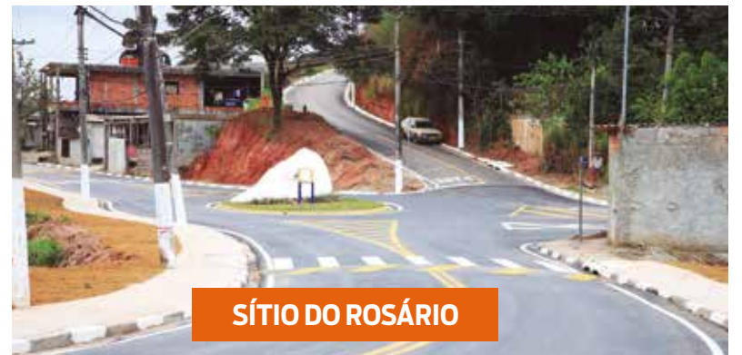
SÍTIO DO ROSÁRIO