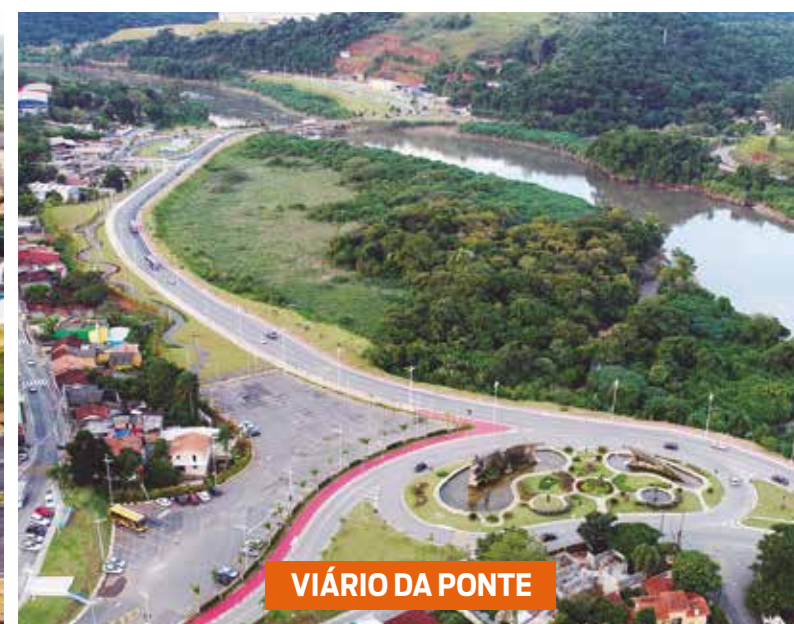
VIÁRIO DA PONTE