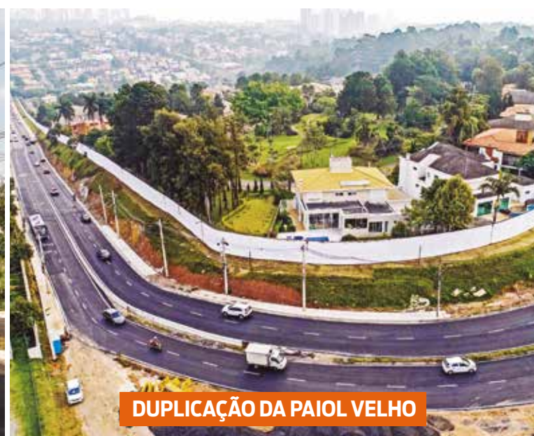
DUPLICAÇÃO DA PAIOL VELHO